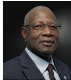
Pr. Abdoulaye Bathily (Sénégal), historien, ancien ministre, ancien Représentant spécial adjoint du Secrétaire général de l'ONU pour le Mali

Souvent, un conflit ou une crise humanitaire provoquent des souffrances et une instabilité d'une ampleur telle qu'ils nécessitent une attention mondiale. Ce rapport démontre que le Sahel est l'une de ces crises. Il met en exergue les échecs de la gouvernance qui ont entraîné des pertes de vies humaines, des opportunités manquées et une dignité perdue pour les populations du Sahel. Ces échecs en matière de gouvernance sont de nature stratégique et se manifestent par la corruption, l'impunité et, par-dessus tout, l'incapacité à placer la protection des citoyens au centre de la réponse au conflit actuel.